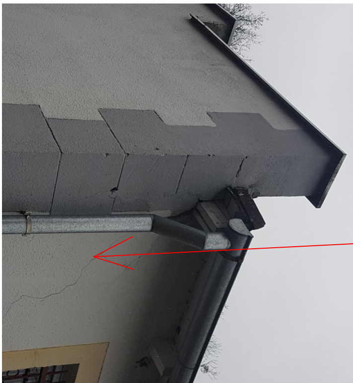
Obszar wzmocnienia pierścienia zewnętrznego w obszarze narożnika budynku